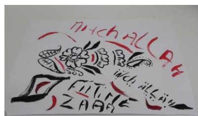
Figure 6, Fatime

Ces plurilittératies, qui apparaissent ici (figures 5 et 7) comme étant le fait d'élèves migrants qui ont construits des compétences hors l'école, naissent aussi parfois au sein de la classe, à l'occasion précisément des ateliers proposés. C'est ce qu'illustre la figure 4, sur laquelle un élève de la CLA-NSA a pris l'initiative de collecter auprès de ses camarades des "échantillons" des différents systèmes d'écriture en présence. Cet exemple, mais celui aussi rencontré dans la classe de SEGPA où un élève français "monolingue" a sollicité l'aide de certains de ses pairs pour écrire son prénom en caractères arabes, ajouté à l'observation des circulations qui se sont fait jour durant les ateliers, me semblent éclairer le plaisir et l'intérêt suscités par les expériences scolaires ou extra-scolaires des pairs. Plaisir et intérêt qui opèrent comme source d'appropriation, de construction de connaissances propres à celui qui utilise pour son œuvre propre les expériences des autres.