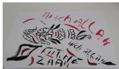
Figure 6, Fatime

Ces plurilittératies, qui apparaissent ici (figures 5 et 7) comme étant le fait d'élèves migrants qui ont construits des compétences hors l'école, naissent aussi parfois au sein de la classe, à l'occasion précisément des ateliers proposés. C'est ce qu'illustre la figure 4, sur laquelle un élève de la CLA-NSA a pris l'initiative de collecter auprès de ses camarades des "échantillons" des différents systèmes d'écriture en présence. Cet exemple, mais celui aussi rencontré dans la classe de SEGPA où un élève français "monolingue" a sollicité l'aide de certains de ses pairs pour écrire son prénom en caractères arabes, ajouté à l'observation des circulations qui se sont fait jour durant les ateliers, me semblent éclairer le plaisir et l'intérêt suscités par les expériences scolaires ou extra-scolaires des pairs. Plaisir et intérêt qui opèrent comme source d'appropriation, de construction de connaissances propres à celui qui utilise pour son œuvre propre les expériences des autres.