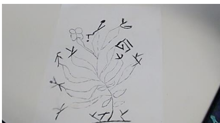
Figure 5, Fatime

Certains élèves nous ont aussi confié pratiquer l'écriture créative dans leur langue, poèmes en mongols, ou contes en arménien par exemple. Pour d'autres, ces ateliers ont été l'occasion d'exprimer à la fois des appartenances et des compétences littéraires auxquelles l'école était jusque-là restée aveugle. Les figures 5 et 7, très différentes l'une de l'autre, peuvent pourtant être rapprochées du fait qu'elles introduisent à l'école des éléments de connaissance et de compétence de leurs auteurs dans l'écriture d'autres langues (l'arabe pour la figure 7 et le gorane pour la figure 5).