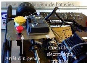
(c) Fixation du contrôleur « SEVCON GEN4 G4845 », du bouton d'arrêt d'urgence et de la prise du chargeur de batteries