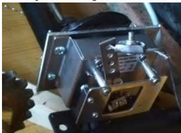
(d) Fixation du potentiomètre d'accélérateur