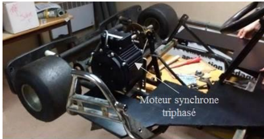
(a) Fixation du moteur synchrone triphasé « ME1304 PMSM Brushless »