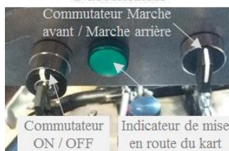
(e) Fixation du tableau de bord