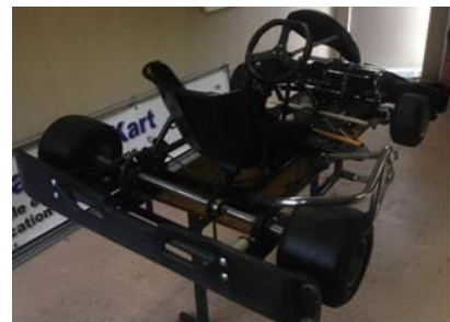
Allègement du châssis (retrait de l'armature en acier et des pontons)

La phase d'aménagement du châssis du kart étant achevée, les élèves ingénieurs ont procédé à la fixation des principaux éléments du système de motorisation électrique : les 4 batteries de 12 V, 38 Ah, le système de branchement des chargeurs de batteries, le moteur synchrone triphasé « ME1304 PMSM Brushless » et le contrôleur électronique triphasé « SEVCON GEN4 G4845 » (cf. Figure 3). La sécurité électrique du véhicule est assurée par l'intermédiaire d'une protection contre les courts circuits, ainsi qu'un coupe-circuit général de type coup-de-poing d'arrêt d'urgence. Bien entendu, les étudiants ont procédé au câblage électrique de tous ces éléments. Quant au tableau de bord, il est constitué d'un commutateur de Marche / Arrêt, d'un voyant lumineux indiquant que le kart électrique est sous tension et d'un commutateur Marche avant / Neutre / Marche arrière.