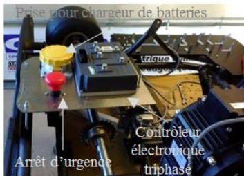
(c) Fixation du contrôleur « SEVCON GEN4 G4845 », du bouton d'arrêt d'urgence et de la prise du chargeur de batteries