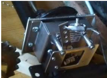
(d) Fixation du potentiomètre d'accélérateur