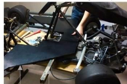
Élargissement et renforcement du châssis