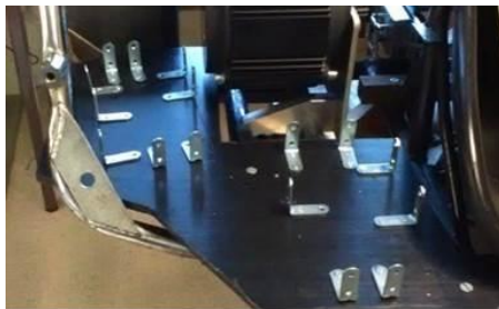
(b) Fixation des supports d'accueil des batteries