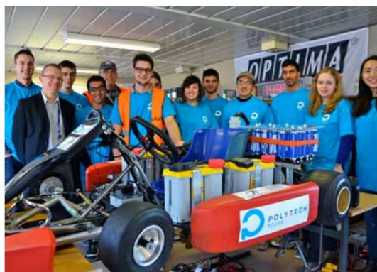
Fig. 4 : Initiative pédagogique saluée par la presse locale (La Tribune Hebdo de Tours, numéro 321)

Ce seront peut-être les concepteurs des « Tesla » françaises de demain ! Une trentaine d'étudiants en ingénierie « Électronique et Systèmes de l'Énergie électrique » de Polytech Tours se sont vu confier une mission bien singulière : concevoir en moins de trois semaines des véhicules électriques à partir de châssis de buggy et de kartings thermiques. Répartis en trois équipes de onze personnes, les étudiants ont été coachés par Sébastien Jacques, enseignant-chercheur à l'origine du concours, Thierry Lequeu, du département de GEII de l'UT de Tours et membre de l'association nationale d'e-karting et de l'entreprise sarthoise, Kart Masters qui développe des solutions pour du véhicule électrique. Partant d'une expression de Ségolène Royale qui veut développer en France des « véhicules électriques populaires », les étudiants ont eu pour mission de