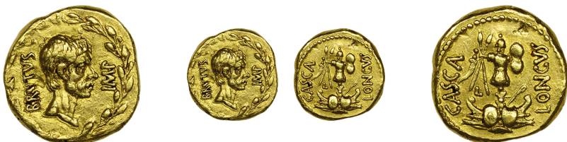
Annexe 2 - Un nouvel exemplaire de RRC 507/1b (8,09 g ; 17,5 mm ; 3-5 h ; coins B/d cf. Hollstein NC 2016 ; agrandissement × 1,5).

Annexe 1 - Résultats des analyses par LA-ICP-MS des 13 aurei des Libérateurs. Teneurs en pour cent ou en ppm. Les teneurs dont les éléments sont notés entre parenthèses ont uniquement une valeur indicative.