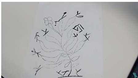
Figure 5, Fatime

Certains élèves nous ont aussi confié pratiquer l'écriture créative dans leur langue, poèmes en mongols, ou contes en arménien par exemple. Pour d'autres, ces ateliers ont été l'occasion d'exprimer à la fois des appartenances et des compétences littéraires auxquelles l'école était jusque-là restée aveugle. Les figures 5 et 7, très différentes l'une de l'autre, peuvent pourtant être rapprochées du fait qu'elles introduisent à l'école des éléments de connaissance et de compétence de leurs auteurs dans l'écriture d'autres langues (l'arabe pour la figure 7 et le gorane pour la figure 5).