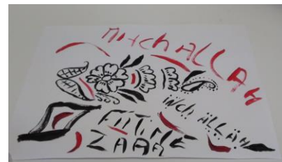
Figure 6, Fatime

Ces plurilittératies, qui apparaissent ici (figures 5 et 7) comme étant le fait d'élèves migrants qui ont construits des compétences hors l'école, naissent aussi parfois au sein de la classe, à l'occasion précisément des ateliers proposés. C'est ce qu'illustre la figure 4, sur laquelle un élève de la CLA-NSA a pris l'initiative de collecter auprès de ses camarades des "échantillons" des différents systèmes d'écriture en présence. Cet exemple, mais celui aussi rencontré dans la classe de SEGPA où un élève français "monolingue" a sollicité l'aide de certains de ses pairs pour écrire son prénom en caractères arabes, ajouté à l'observation des circulations qui se sont fait jour durant les ateliers, me semblent éclairer le plaisir et l'intérêt suscités par les expériences scolaires ou extra-scolaires des pairs. Plaisir et intérêt qui opèrent comme source d'appropriation, de construction de connaissances propres à celui qui utilise pour son œuvre propre les expériences des autres.